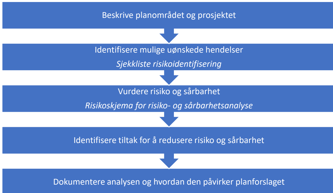
Figur 1 Trinnene i ROS-analysen etter figur i DSB-veilederen «Samfunnssikkerhet i kommunens arealplanlegging»

Denne ROS-analysen følger risikostyringsprosessen etter NS-ISO 31000:2018, som er gitt i V712 konsekvensanalyser. Utførelsen er basert på veiledning gitt i SVV rapport nr. 632 (ROS-analyser i vegplanlegging, ref. 01 og rapport nr. 530 «Risiko og sårbarhetsanalyse av naturfare» ref. 02. Metoden i SVV rapport nr. 632 tar utgangspunkt i DSBs veileder «Samfunnssikkerhet i kommunens arealplanlegging» (DSB, 2017) [ref. 03]. Det er blitt gjort tilpasninger er gjort for å bedre passe for vegprosjekter og for Statens vegvesen som vegeier. Nedenfor vises trinnene i ROS-analysen som en 5-trinnsmetodikk (figur 1), hentet fra DSBs veileder.