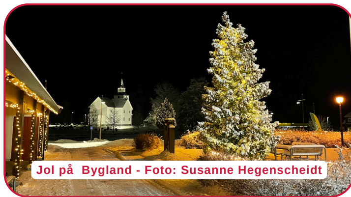
Jol på Bygland - Foto: Susanne Hegenscheidt